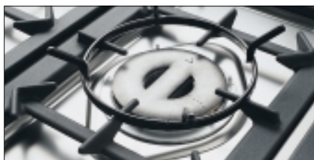
Table grand confort

Les grilles robustes en fonte et les 5 brûleurs accueillent tous les plats même les plus grands. Le brûleur central triple couronne de 4 kW est équipé d'un support wok.