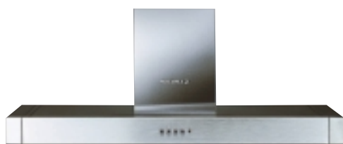
RDM 101 IN